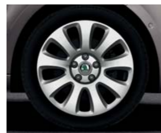
Kola z lehké slitiny s leštěným povrchem Callisto 7,5J x 17" (pneu 225/45 R17).