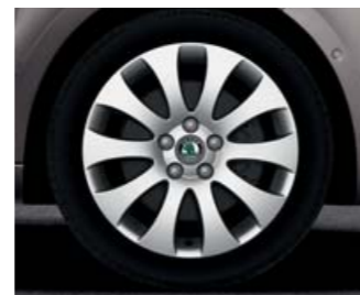
Kola z lehké slitiny Venus 7,0J x 17" (pneu 225/45 R17).