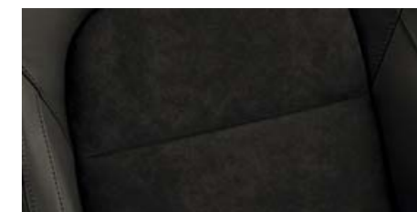
Interiér Emory – Exclusive, Elegance*, Ambition* Alcantara/kůže Vachette/umělá kůže černá