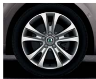
Kola z lehké slitiny Trifid 7,5J x 17" (pneu 225/45 R17).