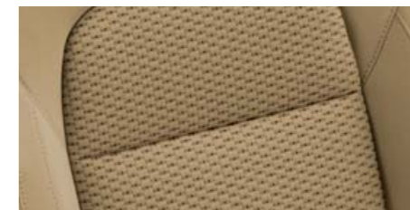
Interiér Felicity – Elegance látka Ivory