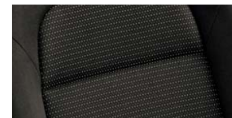
Interiér Ray – Comfort látka černá