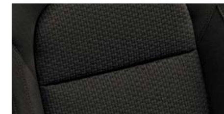
Interiér Felicity – Elegance látka černá