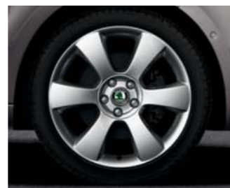
Kola z lehké slitiny Luna 7,5J x 18" (pneu 225/40 R18).