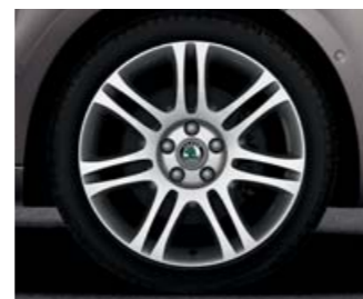
Kola z lehké slitiny s leštěným povrchem Themisto 7,5J x 18" (pneu 225/40 R18).