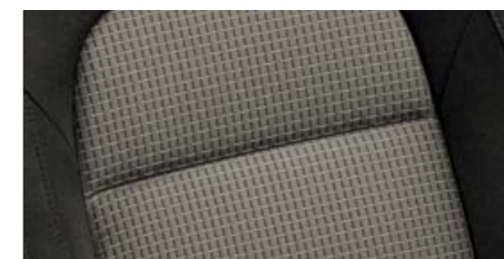
Interiér Rubicon – Ambition látka šedá/černá