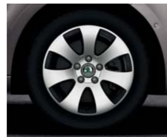
Kola z lehké slitiny Spectrum 7,0J x 16" (pneu 205/55 R16).