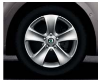
Kola z lehké slitiny Moon 7,0J x 16" (pneu 205/55 R16).