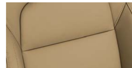
Interiér Glamour – Exclusive*, Elegance* kůže Feinnappa/umělá kůže Ivory

Verze Comfort je dodávána s decentním interiérem Ray v černém provedení. Přístrojová deska a dveře jsou obloženy dekorem Stromboli. Stejně jako v ostatních výbavových verzích zdobí interiér dekorativní prvky provedené v lesklém černém dekoru, jako například kryty otočného spínače světel, klimatizace nebo rádia, a mnoho chromovaných doplňků jako rámečky výdechů ventilace, otočného spínače světel, klimatizace, rádia, hlavice řadící páky a jiné.