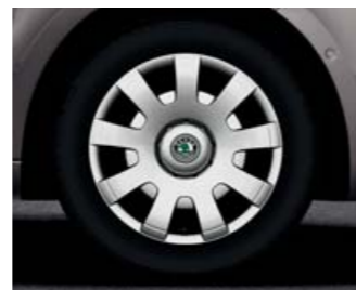
Kola ocelová 7,0J x 16" s velkoplošnými kryty kol Tempel (pneu 205/55 R16).