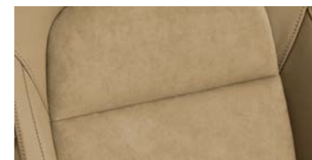
Interiér Emory – Exclusive, Elegance* Alcantara/kůže Vachette/umělá kůže Ivory